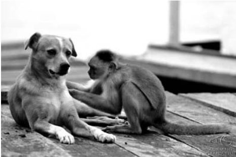
Cachorro e macaco-prego num tapume, à beira do Rio Negro, AM.